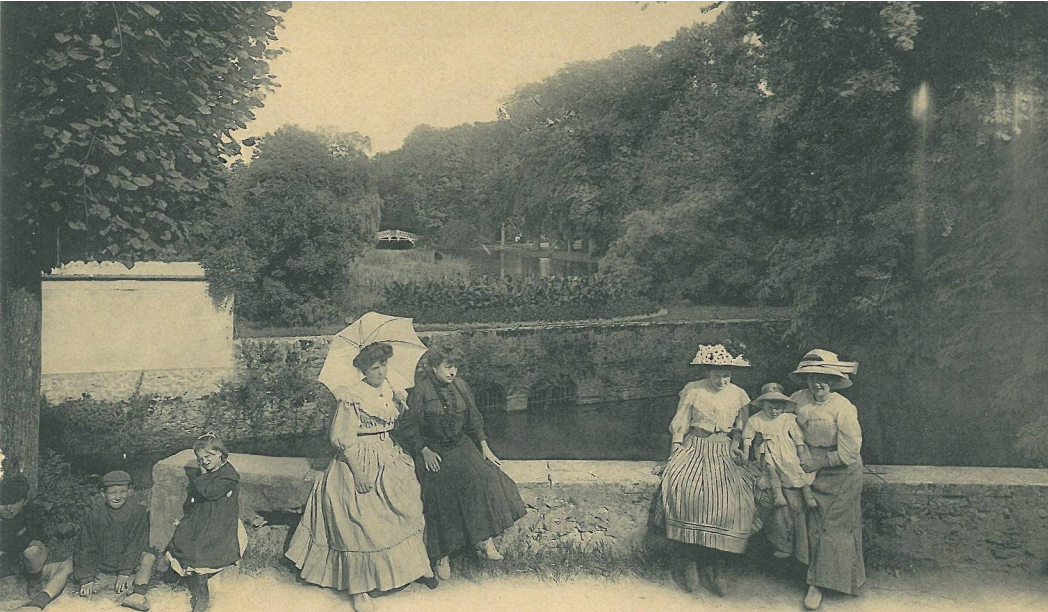
33. OZOUER-LA-FERRIÈRE — Le Parc du Château de la Doure