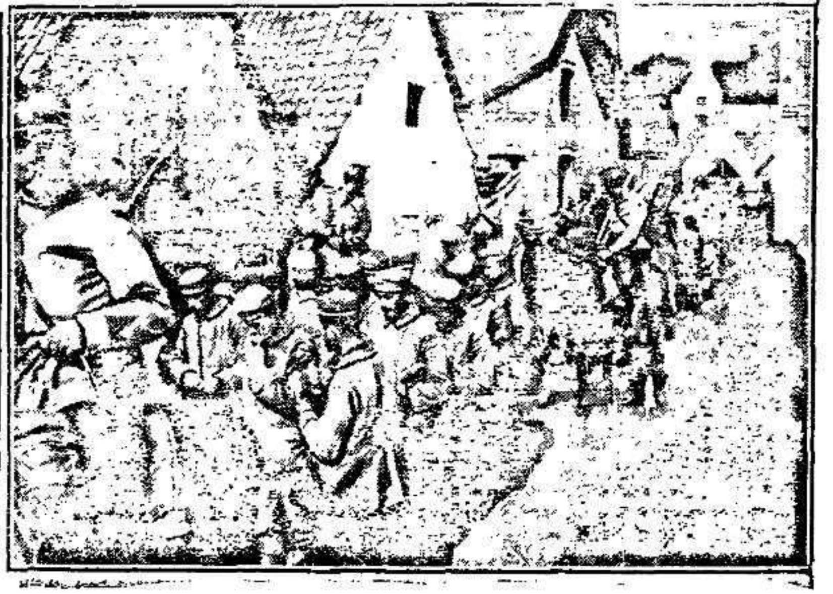
NOTRE VICTORIEUSE OFFENSIVE EN CHAMPAGNE. — UN CONVOI DE PRISONNIERS TRAVERSANT UN VILLAGE A L'ARRIERE

STOCKHOLM, 14 OCTOBRE. A la suite de la perte du vapeur allemand « Germania », coulé par un sous-marin anglais dans la Baltique, on déclare de source officielle que les renseignements parvenus jusqu'à Stockholm par le sous-marin, le représentant de la Suède à Londres a été chargé d'écrire un communiqué de protestation.